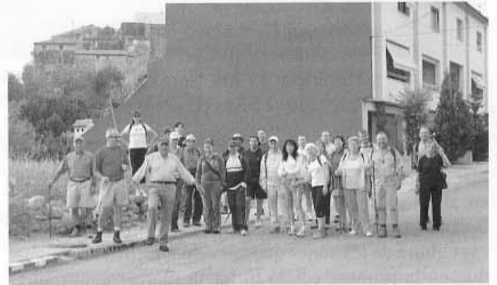
Els participants a l'eixida del poble